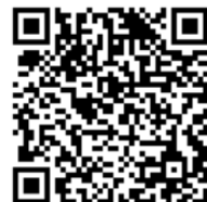
登録用二次元コード